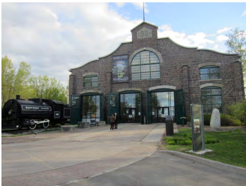
La pulperie de Chicoutimi

Organisé par la Fédération (FHQ) conjointement avec la Fédération québécoise des sociétés de généalogie (FQSG), en collaboration avec la Société Historique du Saguenay et la Société de généalogie du Saguenay, le congrès a accueilli plus de 200 personnes préoccupées par la pérennité de leurs organismes et par la place de l'histoire et du patrimoine au Québec.