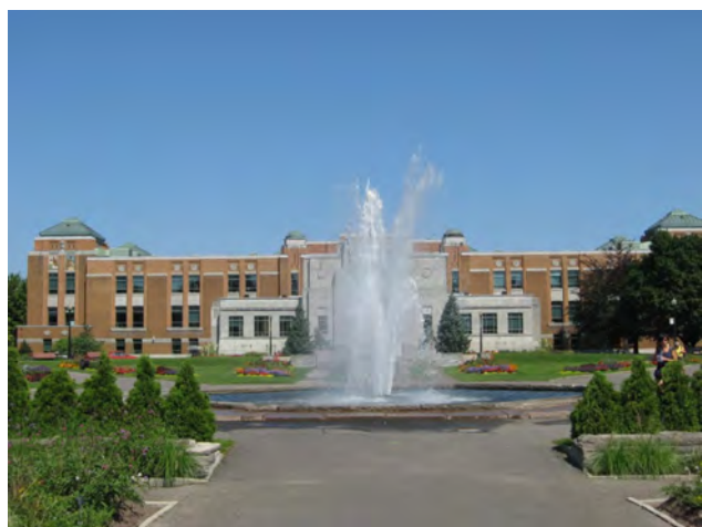
Fontaine à 17 jets au Jardin botanique