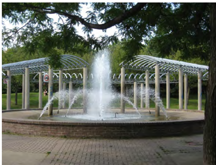
Fontaine J-Arthur Champagne, secteur Angus