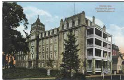
Séminaire de Joliette, sans date.