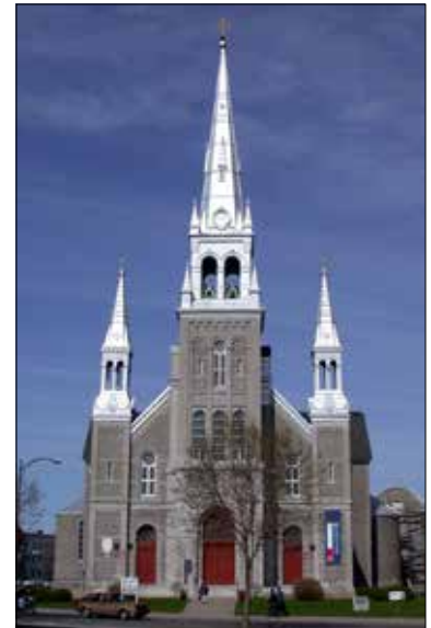
Cathédrale de Joliette, 2002.

Que dire des 150 ans de grande musique à Joliette ? Dès les origines de la petite communauté, les Clercs de Saint-Viateur et les religieuses de la Congrégation de Notre-Dame ont pris la direction des grandes institutions musicales pour créer une vie artistique et musicale vivante. La fanfare, l'orchestre, la chorale du Collège mettent en valeurs les activités dramatiques. La grande musique sacrée est au cœur des fêtes religieuses. On ne peut passer sous silence le dévouement des Pères Bellemare, Rolland Brunelle et Fernand Lindsay qui ont motivé les éducateurs d'hier et ceux d'aujourd'hui. Chaque été depuis 1978, le Festival international de Lanaudière attire une foule considérable de mélomanes.