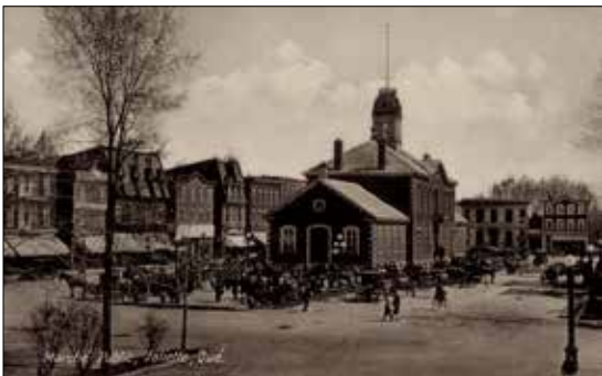
Marché de Joliette, années 1920.