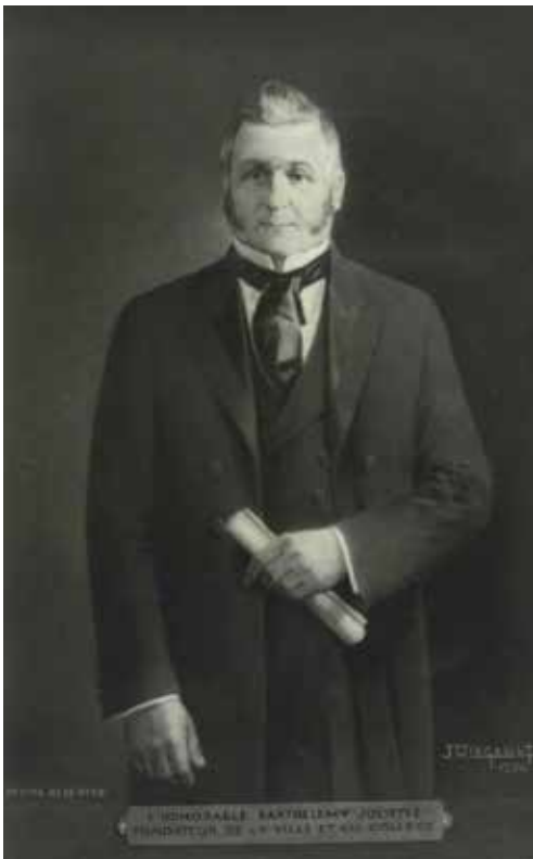
Carte postale représentant B. Joliette. © BANQ, vers 1936.

L'œuvre de ces bâtisseurs s'accompagne de l'apport migratoire anglais, celui des écossais et des irlandais dispersés un peu partout mais plus densément présents dans le canton de Rawdon au nord des seigneuries. Vers 1930 des gens originaires de l'Europe de l'est, (Russie, Ukraine, Pologne) peuplent ces lieux.