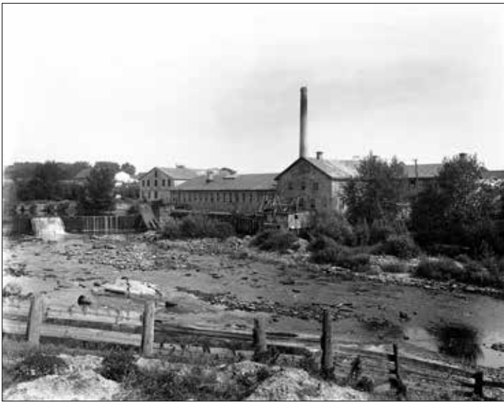
Le moulin McArthur en 1909.

Joliette découvre la forêt de pins blancs dont il exporte le bois d'oeuvre en Angleterre. Les courageux colons-défricheurs fournissent en bois le moulin à scie, en blé les moulins à farine, et alimentent les autres moulins. Magasin général, marché public (aujourd'hui Place Bourget), fonderie, métallurgie, biscuiterie occupent le centre villageois. Joliette fait construire à ses frais une église paroissiale, un presbytère et un collège, dont la direction est confiée aux Clercs de Saint-Viateur à la demande de Mgr Ignace Bouget. Barthélemy Joliette réalise son rêve de construire un chemin de fer conduisant au quai de Lanoraie pour y descendre son bois coupé.