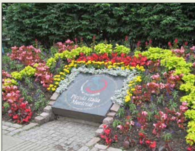
Parc de la Petite-Italie.

Les Promenades de Jane sont un événement – hommage organisé simultanément dans une centaine de villes à travers le monde, en l'honneur de Jane Jacobs, une auteure, militante et philosophe de l'architecture et de l'urbanisme.