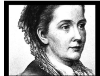
Julia Ward Howe

L'idée fit son chemin. En 1924, le président Calvin Coolidge soutint l'idée que cette fête devienne nationale. Il faudra attendre en 1966 pour que le Président Lyndon Johnson signa une déclaration présidentielle qui institua le troisième dimanche de juin, « Father's Day » au plan national. Bonne Fête des pères !