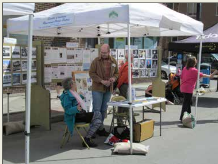
Kiosque de la SHRPP.

Des membres bénévoles disponibles se sont partagé l'accueil au kiosque situé devant le 2948, rue Masson ou au local du 5442, 6 e Avenue. La SHRPP remercie les personnes qui se sont arrêtées pour échanger leurs souvenirs.