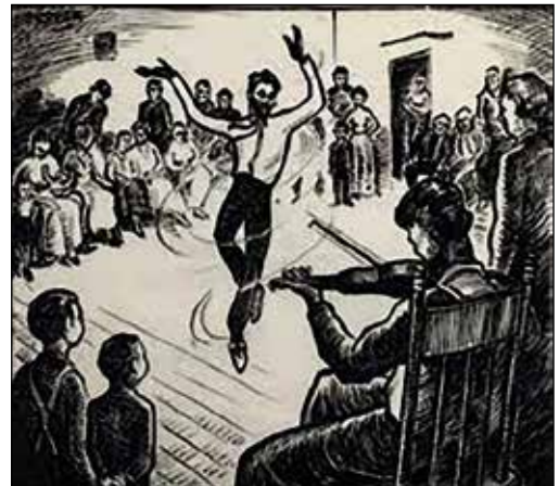
Un danseur diablement séducteur!

On peut donc imaginer l'état d'esprit des premiers habitants de la Nouvelle-France, entourés de forêts à perte de vue ! Pas étonnant que, très souvent, les Amérindiens aient été décrits comme des créatures du mal... Toutefois, après quelques générations, le Diable a progressivement quitté la forêt : Satan est devenu davantage une représentation de l'inverse de la morale religieuse. Plus tard, l'histoire le présentera sous les traits d'un voyageur, d'un homme beau et grand, ou d'un séducteur, habituellement vêtu de noir.