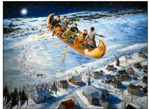
Haute voltige !

Une des légendes les plus connues chez les Canadiens-Français est celle de la chasse-galerie, laquelle provenait sans doute de la région du Poitou, en France. À une certaine époque du Moyen Âge, cette région avait été une possession anglaise où avait habité un certain seigneur de Gallery. Ce dernier commettait toutes les exactions possibles, ce qui n'était pas sans choquer les habitants qui y vivaient. Par exemple, il tenait des parties de chasse les dimanches lors de la messe... sacrilège ! À sa mort, le sire de Gallery aurait donc été condamné à chasser la nuit, et ce, pour l'éternité. Si l'on considère que la région du Poitou a fourni un grand nombre de colons pour peupler la Nouvelle-France, il serait alors possible que ces derniers aient emmené cette légende dans le nouveau monde et l'auraient adapté à leur nouvel environnement en mettant en scène un canot volant.