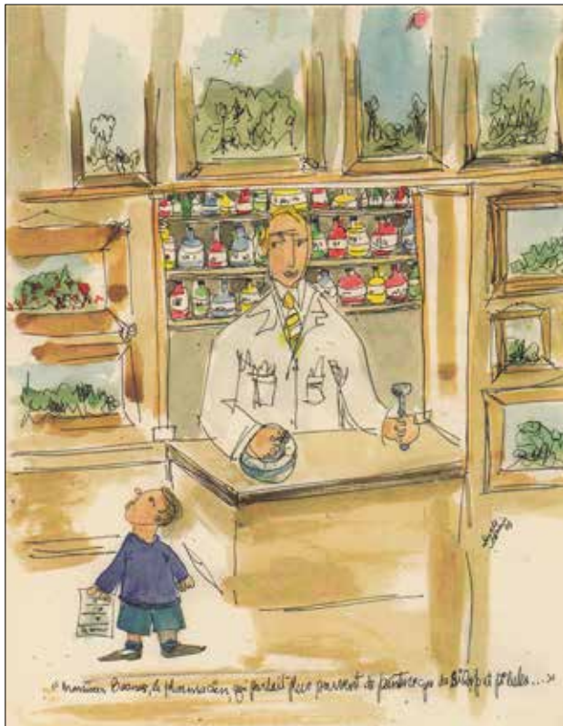
Illustration originale de Claude Jasmin, tirée de La petite patrie en images , Éditions du Lilas, 2003.

Le mercredi 14 septembre 2016, à 19 h 30