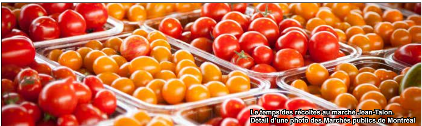
Le temps des récoltes au marché Jean-Talon.

Retrouvez la version en couleurs du Saisonnier sur le site de la SHRPP www.historerpp.org