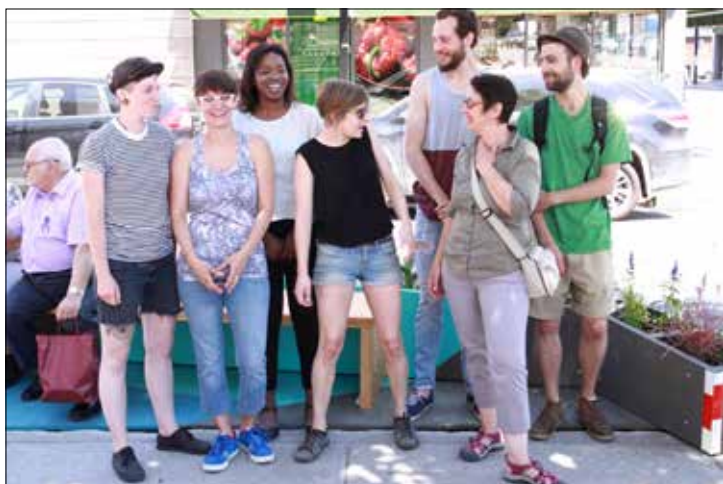
Artisans de l'École d'ébénisterie d'art de Montréal.

La terrasse rend hommage à Eugène Bélanger qui a légué ses valeurs de travail, de dévouement, de ténacité et d'honnêteté à toute une génération dont son fils Claude, puis son petit-fils, Dominique, qui ont pris la relève de la quincaillerie.