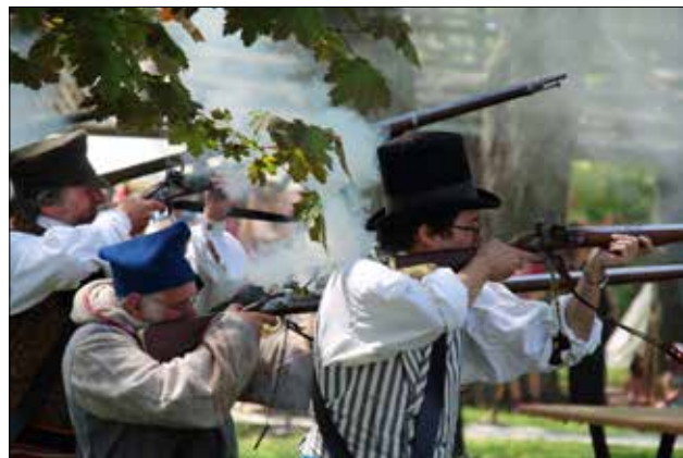
Reconstitution historique de la bataille des Patriotes à Saint-Denis.