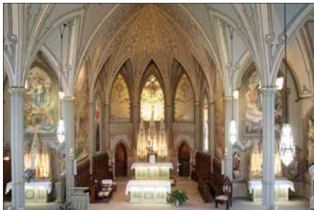
Visite de l'église de Mont-Saint-Hilaire.

En conclusion, le congrès a donné l'occasion aux Sociétés d'histoire d'enrichir leurs connaissances et de se réunir autour d'un thème rassembleur, soit l'histoire et le patrimoine du Québec.