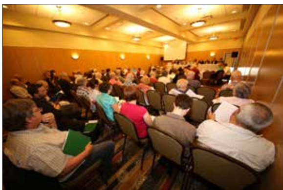
Sociétés d'histoire en assemblée au congrès de la FHQ.

Le Congrès de la Fédération Histoire Québec (FHQ) a rassemblé un grand nombre de Sociétés d'histoire à Saint-Jean-sur-Richelieu du 21 au 23 mai 2016. Parmi les 200 participants, il y avait six membres de la Société d'histoire Rosemont - Petite-Patrie.