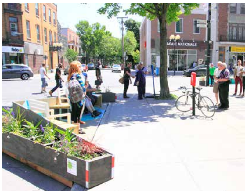
La terrasse Eugène-Bélanger.

Fait intéressant, la terrasse est au pied des marches de l'église Saint-Esprit, ces marches qui accueillent nombre de citoyens à la recherche d'un endroit pour s'asseoir, jaser, grignoter ou laisser filer le temps tout en regardant véhicules et passants circuler sur la rue Masson. L'endroit est à une plus petite échelle l'équivalent des centaines de marches remplies de monde, devant des églises célèbres dont la basilique du Sacré-Cœur de Montmartre à Paris.